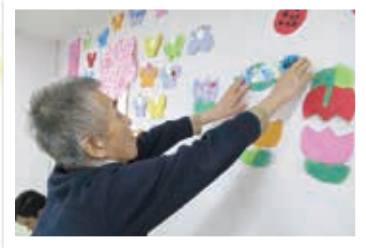
飾りつけも ひとつのアートです