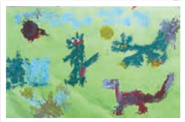
ゆきわり荘の 知画伯